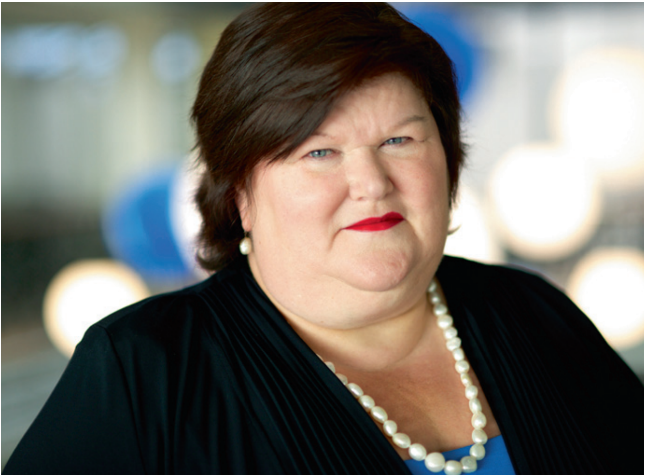
> Dokter Maggie De Block, minister van Sociale Zaken en Volksgezondheid